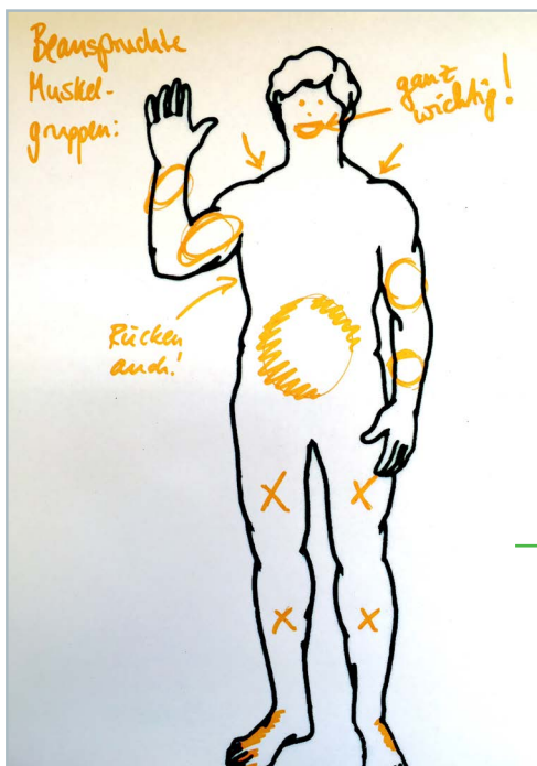
Abb. 1

Fragt man Schüler*innen nach gesundheitsfördernden Verhaltensweisen, so benennen diese sofort Ernährung und Sport. Alltägliche Bewegungen, wie das Laufen oder Radfahren zur Schule, Treppen steigen oder die Arbeit im Garten werden dagegen deutlich negativer eingeschätzt: „Das sind so Tätigkeiten, die man unbewusst im Alltag tut und die belastend für den Körper sind.“ (alle Zitate von Noelle, 15 Jahre). Als Beispiele für die Belastungen berichten sie von Schmerzen, z. B. beim Tragen des „schweren Schulranzens“ oder sie bekommen „relativ schnell Rückenschmerzen“ beim Fegen oder gebückten Arbeiten. Sport wird dagegen als positiv eingestuft, da man sich „bewusst, gezielt und ordentlich“ bewegt und „viele Muskeln aufbauen kann“. Im Gegensatz dazu empfiehlt die WHO mindestens 60 Minuten gemäßigt anstrengender Bewegung, wozu explizit auch Alltagsbewegungen gezählt werden (WHO 2015), wenn diese in gesundheitsfördernder Weise ausgeführt werden.