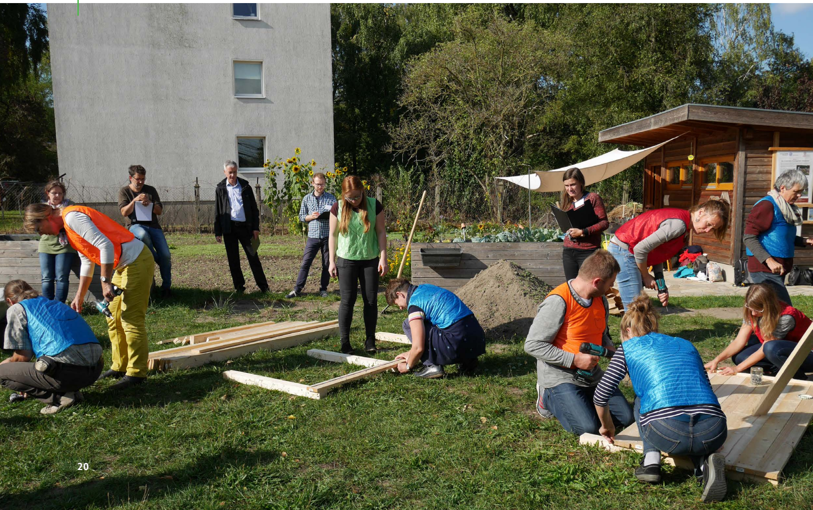
Beobachtungen von sozialen Interaktionen während der Gartenarbeit.

Das Ergebnis der Beobachtung von Gartentätigkeit im Vergleich zur Einführungsphase zeigte, dass soziale Interaktionen häufiger in offen gestalteten Arbeitsphasen, wie z. B. während des Hochbeetbaus, stattfinden. Die sozialen Interaktionen während der Gartenarbeit sind dabei auch vielfältiger und können die sozialen Kompetenzen entsprechend stärken. Dabei sollte man Augenmerk auf die Aspekte der Mitbestimmung, der freien Gestaltung und der sozialen Eingebundenheit legen - wichtige Punkte, die in der Gartenarbeit mit Schulklassen förderlich sind.